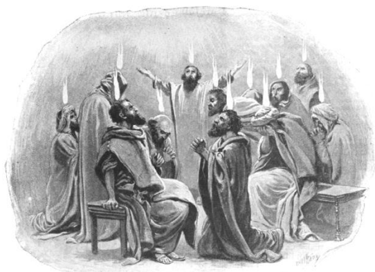
"There appeared unto them cloven tongues like as of fire,"—Act 2, 3.

L' Eglise du Nouveau Testament est née dans un flamboiement de gloire. Le Saint-Esprit est descendu sur elle et l'a baptisée de feu; et les premiers chrétiens parlaient en langues et prophétisaient. Ils expérimentaient une conviction frappante [de la présence de Dieu] et des multitudes se convertissaient. Ils se répandaient à droite et à gauche et se multipliaient considérablement. La crainte de Dieu les saisissait ainsi que tous ceux qui les voyaient. Il y avait des signes , des prodiges et des miracles . Les morts ressuscitaient. Des évangélistes sans peur allaient partout, prêchant la Parole. Les prisons ne pouvaient les retenir. Les tempêtes ne pouvaient les noyer. Lorsque leurs biens étaient saisis, ils continuaient à se réjouir. Lorsqu'ils étaient lapidés, pendus, brûlés ou crucifiés, ils mouraient en chantant et louant Dieu. C'était une Eglise triomphante, ne craignant pas Satan, irrévérencieuse envers les idoles, impassible face aux fléaux ou aux persécutions. C'était une Eglise lavée par le sang [de Jésus], vivant et mourant victorieusement.