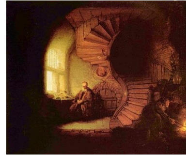
Un philosophe en train de méditer

En prédisant un jugement futur sur le monde incroyant, le Seigneur Jésus se référait au «commencement du monde que Dieu a créé», affirmant ainsi la doctrine biblique d'une création surnaturelle et soudaine. Dans le monde païen de son temps, l'évolutionnisme dominait presque partout. Les épicuriens, par exemple, étaient des évolutionnistes athées. Les stoïciens, les gnostiques, les platoniciens ainsi que d'autres étaient des évolutionnistes panthéistes. Aucun des philosophes extrabibliques du temps de Jésus ne croyait en un Dieu ayant créé toutes choses, y compris même le monde entier.