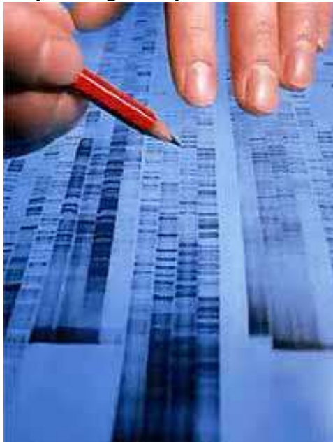
Séquence génétique de l'ADN